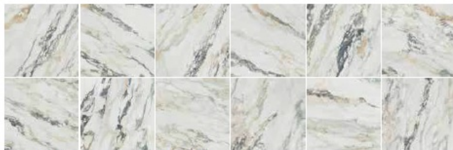
80X160 - 6 PEZAS/6 PÉCES/6 PIÈCES 80X80 - 12 PEZAS/12 PÉCES/12 PIÈCES