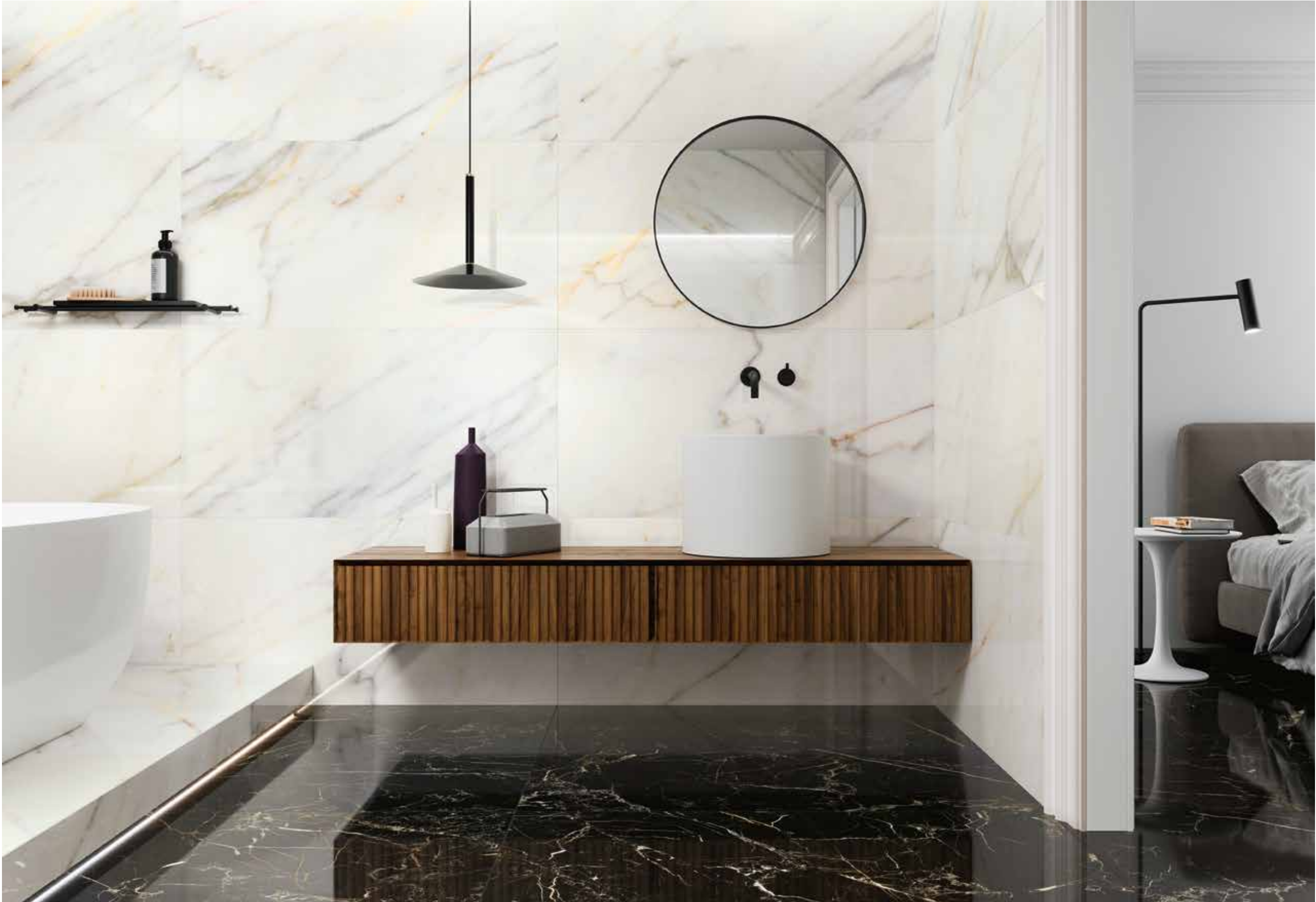
CALACATTA SLOW POL RECT 60X120 NIGHT LUX POL RECT 60X120