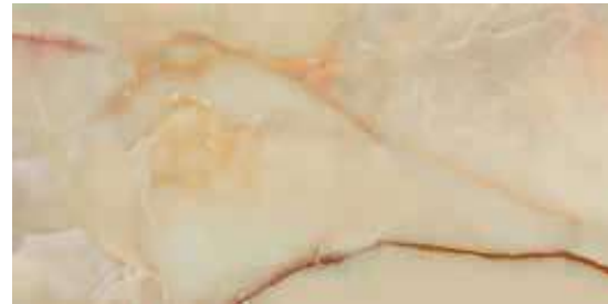
ONICE HONEY POL. RECT. 60X120 / 24"X48" J89/M