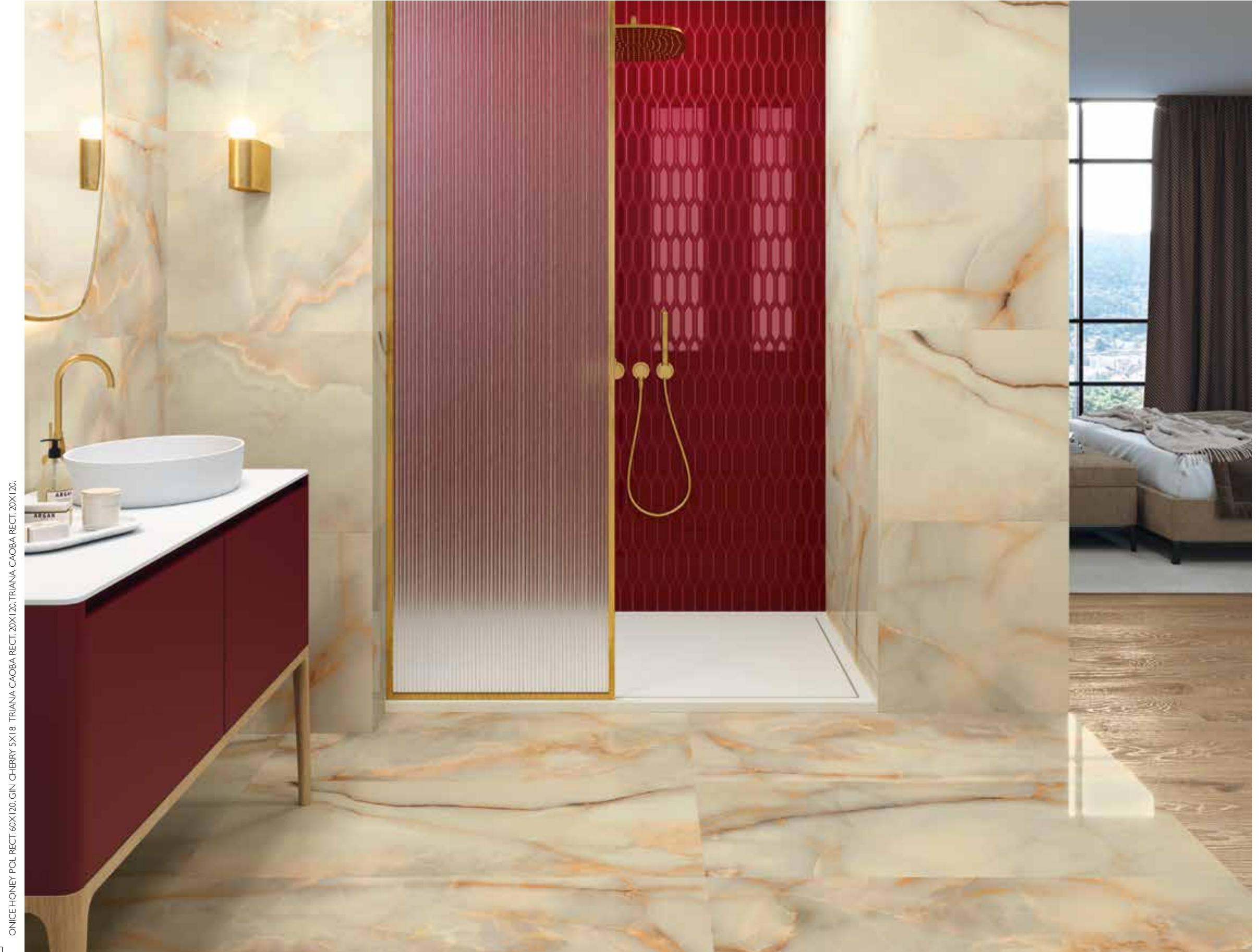
ONICE HONEY POL RECT.60X120. GIN CHERRY 5X18. TRIANA CAOBA RECT.20X120. TRIANA CAOBA RECT.20X120.