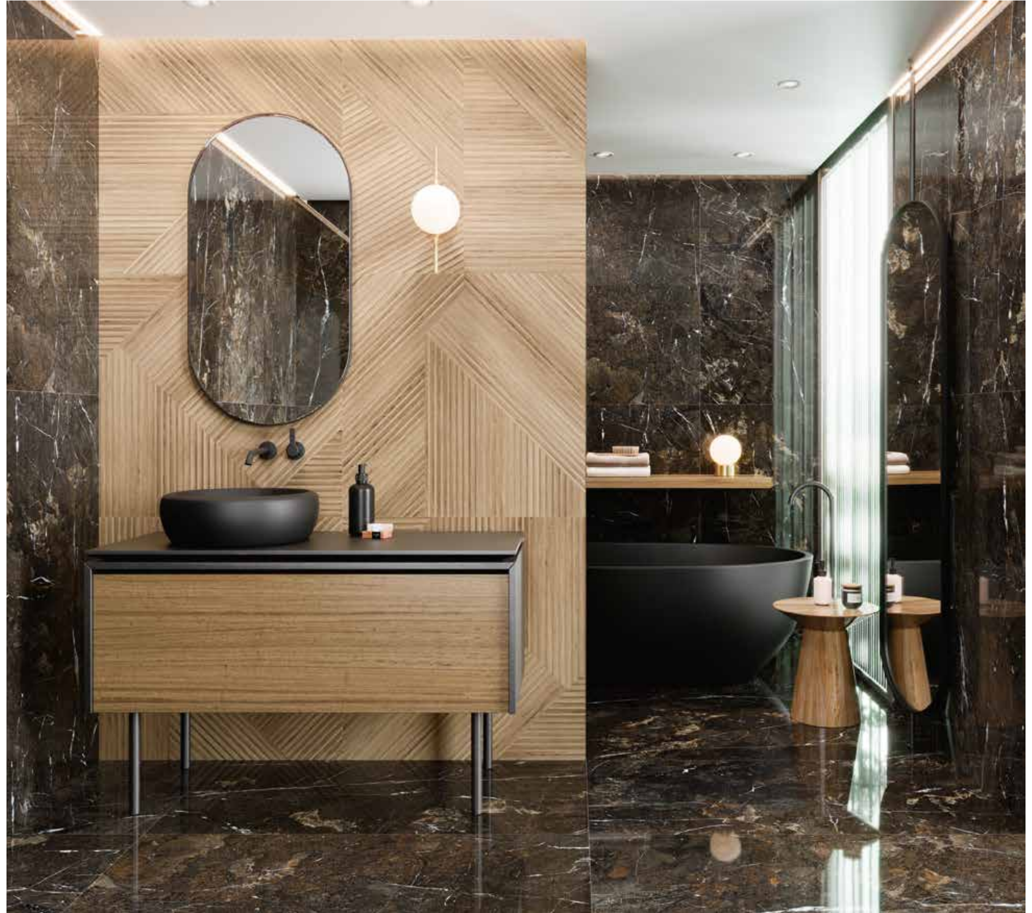
AMARULA POL RECT 60X120. ZAKU CARAMELLO MATT RECT. 80X80