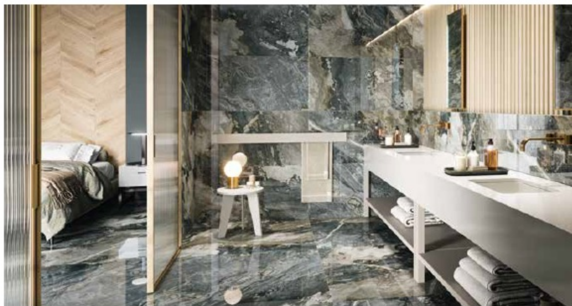
DEDALLUS POL RECT 120X120 · DEDALLUS POL RECT 60X120

120X120 - 9 PIEZAS/9 PIECES/9 PIÈCES 60X120 - 18 PIEZAS/18 PIECES/18 PIÈCES