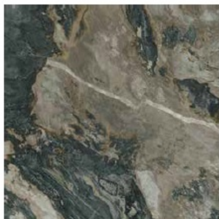
D EDALLUS POL RECT. 120X120 / 48"X48"