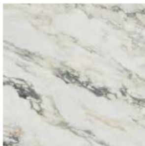
CAPRAIA BIANCO POL. RECT. 80 X 80 / 32" X 32"