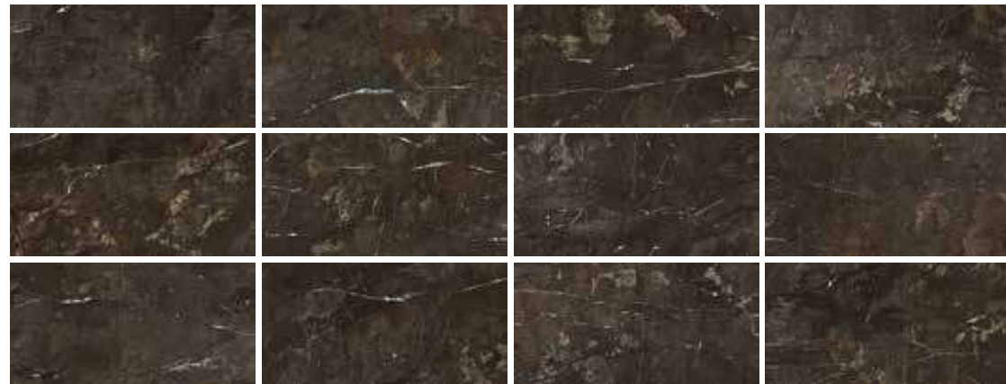
60X120 - 12 PIEZAS/12 PIECES/12 PIÈCES