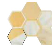
HEXA BOHO CALACATTA SLOW 13,9X16 / 5,5"X6,3" L07/M