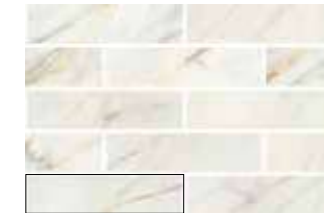
CALACATTA SLOW MATT 7,5X30 / 3"X12" L20/M