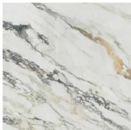
CAPRAIA BIANCO POL. RECT. 120 X 120 / 48" X 48"