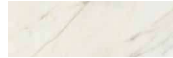
CALACATTA SLOW MATT RECT. 40X120 / 16"X48" L25/M