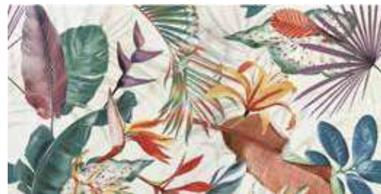
DECOR SET (2) CALACATTA SLOW POL. 60X120 / 24"X48" K68/P