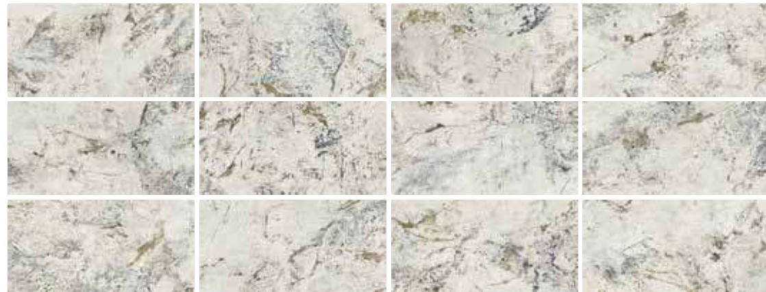
60X120 - 12 PIEZAS/12 PIECES/12 PIÈCES 90X90 - 9 PIEZAS/9 PIECES/9 PIÈCES