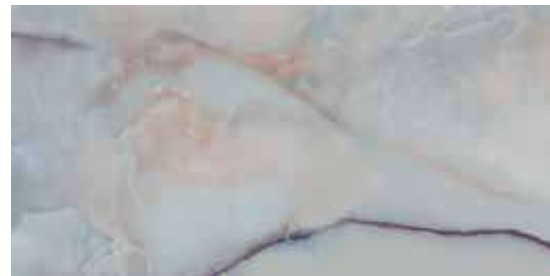
ONICE SKY POL. RECT. 60X120 / 24"X48" J89/M