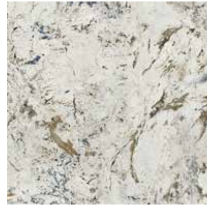
ALPEN QUARTZ POL. RECT. 90X90 / 36"X36" P47/M