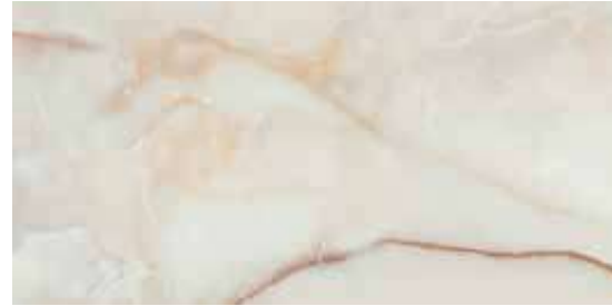
ONICE NACAR POL. RECT. 60X120 / 24"X48" J89/M