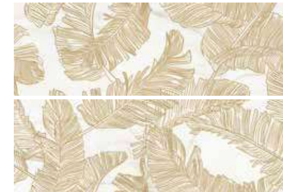
DECOR SET (2) FEATHER CALACATTA 40X120 / 16"X48" K81/P