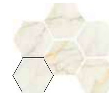
HEXAGON CALACATTA SLOW 13,9X16 / 5,5"X6,3" N70/M