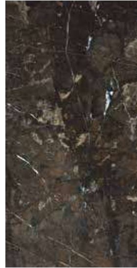
AMARULA POL RECT. 60X120 / 24"X48" J89/M