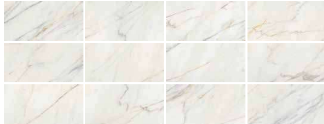
60X120 - 12 PIEZAS/12 PIECES/12 PIÈCES 60X60 - 24 PIEZAS/24 PIECES/24 PIÈCES