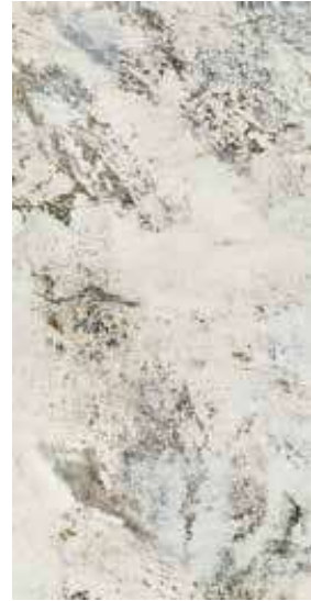
ALPEN QUARTZ POL. RECT. 60X120 / 24"X48" J89/M