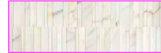
PLACID CALACATTA SLOW MATT RECT. 40X120 / 16"X48" L26/M