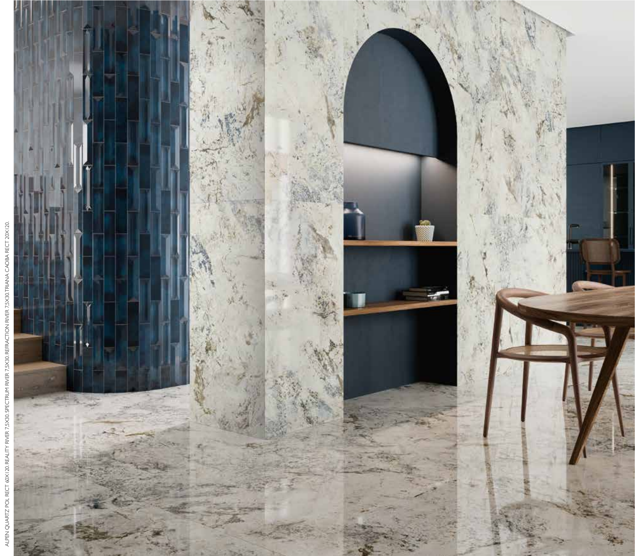
ALPEN QUARTZ POL. RECT. 60X120.REALITY RIVER 7.5X30.SPECTRIUM RIVER 7.5X30.TRIANIA CAOBA RECT.20X120.