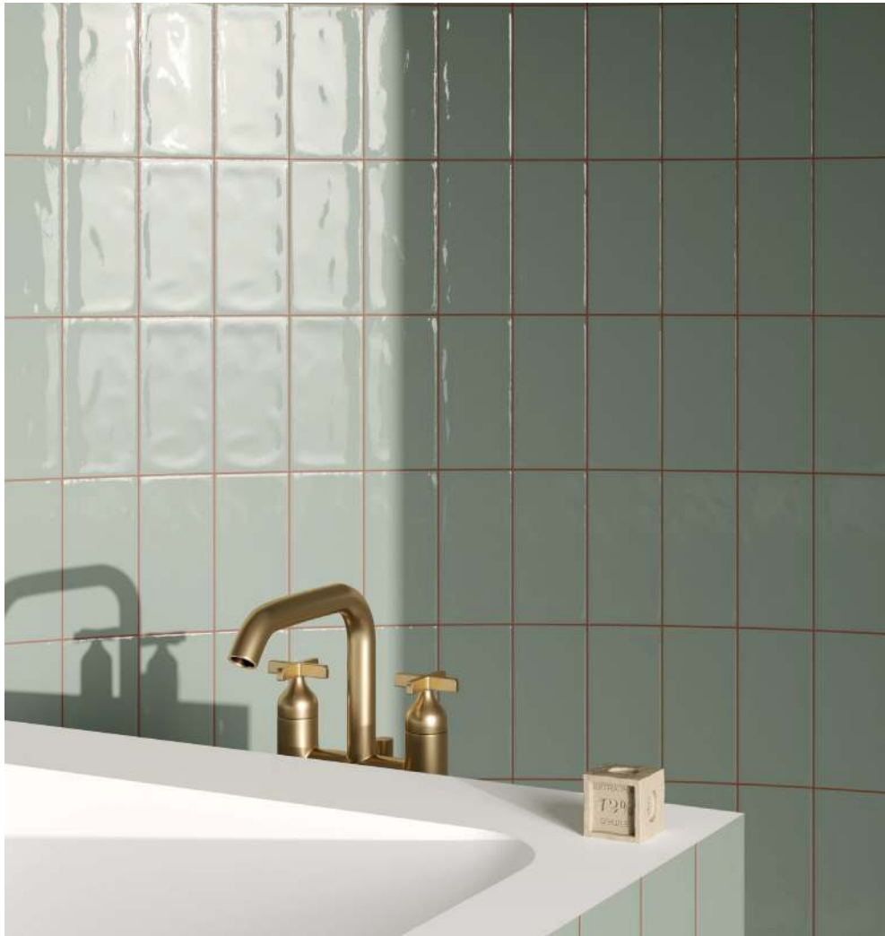
Rivestimento/Wall: Materia TR Mastice 10 x 20 cm