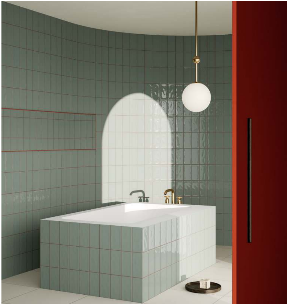
Rivestimento/Wall: Materia TR Mastice 10x20 cm